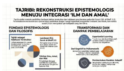
Gambar 1. Tajribi sebagai Fondasi Teoretis