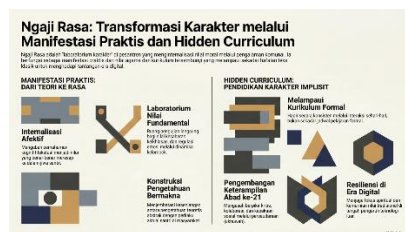
Gambar 2. Ngaji Rasa sebagai Manifestasi Praktis dan Hidden Curriculum