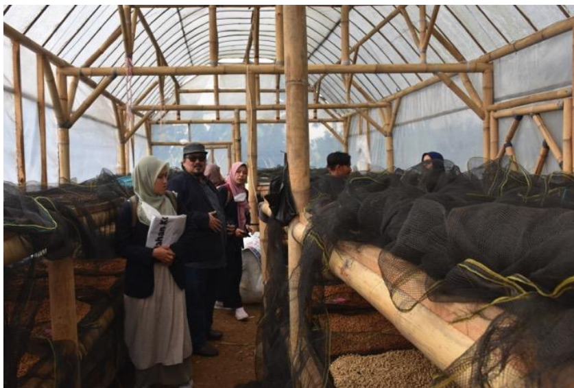
Gambar 2. Kegiatan Observasi di Saninten Coffee

Permasalahan yang dihadapi oleh Saninten Coffee adalah menurunnya pendapatan para petani kopi di masa pandemi Covid-19, oleh karena itu diperlukan strategi untuk meningkatkan pendapatan para petani kopi dengan cara mengoptimalisasikan peran sumber daya manusia. Kegiatan pengabdian pada masyarakat ini dilaksanakan dengan cara melakukan diskusi dan pendampingan terkait perumusan strategi dalam mengoptimalisasikan peran sumber daya manusia di Saninten Coffee.