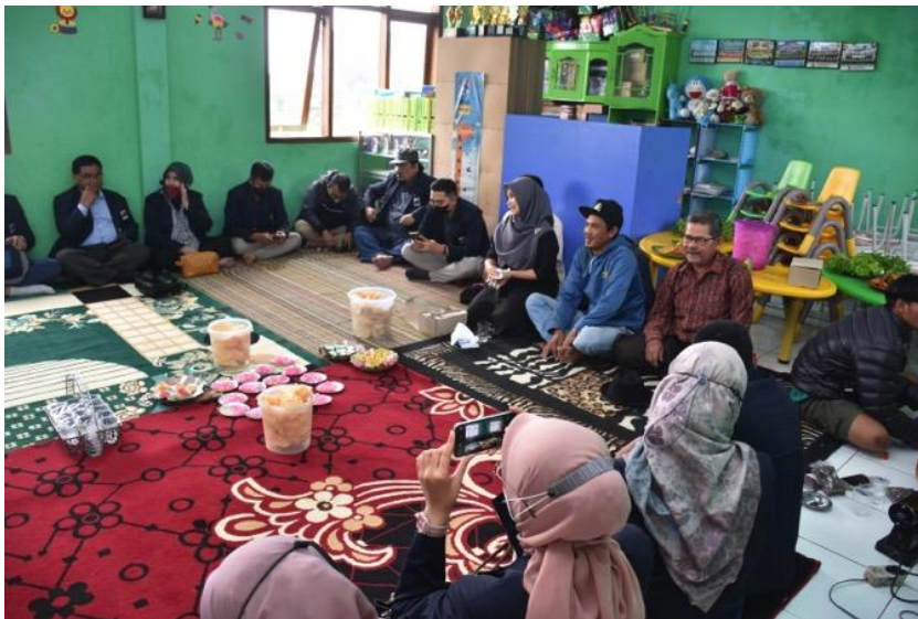
Gambar 3. Diskusi antara Magister Manajemen Univeritas Adhirajasa Reswara Sanjaya dan Saninten Coffee

Upaya untuk mengoptimalkan peran sumber daya manusia petani kopi adalah mengubah paradigma petani. Menurut Sadono (2008) untuk memberdayakan petani diperlukan perubahan paradigma dari paradigma lama yang lebih menekankan pada alih teknologi ke paradigma baru yang mengutamakan pada sumberdaya manusia atau pendekatan farmer first, yakni dengan “mengubah petani”, bukan “mengubah cara bertani”. Di Era MEA, peran kelembagaan petani sangat penting karena melalui kelembagaan petani dapat meningkatkan posisi tawar ( bargaining position ), bernegosiasi, memperluas jaringan pasar dengan membuat nota kesepahaman (MoU) dalam pemasaran hasil dengan harga yang telah disepakati (Sumarti et al., 2017). Penguatan kelembagaan memerlukan peran penyuluh sebagaimana amanah UU Nomor 16 tahun 2006 tentang Sistem Penyuluhan Pertanian Perikanan dan Kehutanan (SP3K) yang menyebut penyuluhan sebagai proses pembelajaran bagi pelaku utama serta pelaku usaha agar mereka mau dan mampu menolong dan mengorganisasikan dirinya dalam mengakses informasi, pasar, teknologi, permodalan dan sumberdaya lainnya, sebagai upaya untuk meningkatkan produktivitas, efisiensi usaha, pendapatan dan kesejahteraannya serta meningkatkan kesadaran dalam pelestarian fungsi lingkungan hidup.