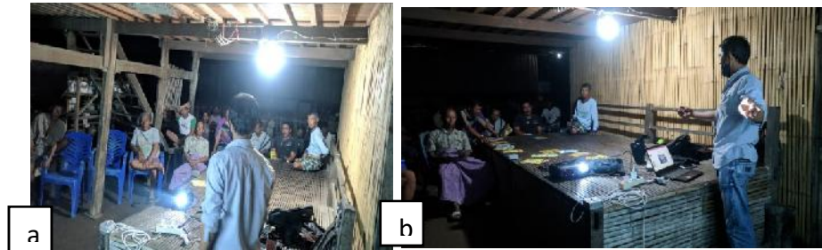
Gambar 3. Pemaparan Materi Pengabdian

Tahap terakhir kegiatan yaitu diskusi dan evaluasi. Evaluasi berupa pemberian post test secara lisan seperti terlihat pada gambar 4. Hasil post test menunjukkan bahwa para peserta rata-rata telah memahami hal-hal yang berkaitan dengan kanker prostat, seperti usia dan life style misalnya bahaya rokok. Hal ini menunjukkan bahwa kegiatan pengabdian masyarakat merupakan salah satu sarana yang dapat digunakan untuk meningkatkan pengetahuan peserta. Hal ini sesuai dengan 8 yang menyatakan bahwa kegiatan pengabdian merupakan salah satu wujud kepedulian untuk meningkatkan pengetahuan masyarakat.