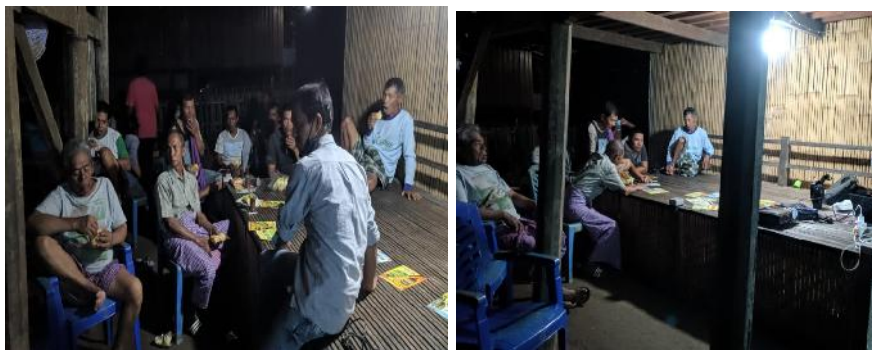
Gambar 4. Diskusi

Tahap terakhir kegiatan yaitu diskusi dan evaluasi. Evaluasi berupa pemberian post test secara lisan seperti terlihat pada gambar 4. Hasil post test menunjukkan bahwa para peserta rata-rata telah memahami hal-hal yang berkaitan dengan kanker prostat, seperti usia dan life style misalnya bahaya rokok. Hal ini menunjukkan bahwa kegiatan pengabdian masyarakat merupakan salah satu sarana yang dapat digunakan untuk meningkatkan pengetahuan peserta. Hal ini sesuai dengan 8 yang menyatakan bahwa kegiatan pengabdian merupakan salah satu wujud kepedulian untuk meningkatkan pengetahuan masyarakat.