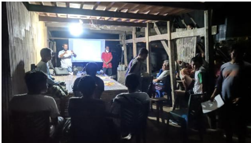
Gambar 2. Acara Pembukaan Oleh Tim Pengabdian

Kegiatan pengabdian dalam hal ini bermaksud untuk melihat kemampuan awal para peserta sebelum dilakukan pemberian materi pada Gambar 2.