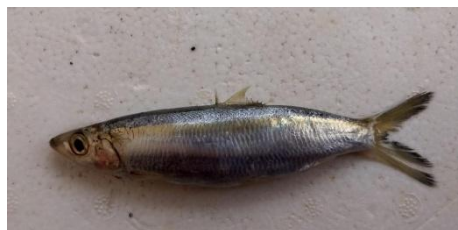
Gambar 2. 1 Ikan Tembang

Ikan tembang ( Sardinella fimbriata ) merupakan ikan pelagis kecil dari famili Clupeidae yang hidup bergerombol, bermigrasi, dan memiliki peran ekologis serta ekonomis penting di wilayah tropis dan subtropis. Dalam sistem perikanan Indo-Pasifik, kelompok sardin dan herring tropis merupakan sumber daya penting, tetapi pengetahuan ilmiahnya masih tersebar dalam kajian lokal dan sering menghadapi kesulitan taksonomi karena banyak spesies memiliki kemiripan morfologis, terutama dalam perikanan campuran skala kecil (Hunnam, 2021). Kondisi tersebut menjadikan identifikasi ilmiah penting, sebab istilah “sardin” sering digunakan sebagai nama umum untuk beberapa ikan pelagis kecil famili Clupeidae, sedangkan ikan tembang merujuk secara lebih spesifik pada Sardinella fimbriata (Hunnam, 2021). Secara taksonomi, ikan tembang termasuk Kingdom Animalia, Phylum Chordata, Class Actinopterygii, Order Clupeiformes, Family Clupeidae, Genus Sardinella , dan Species Sardinella fimbriata Menurut fishbase (2018), Klasifikasi Ikan Tembang Adalah Sebagai Berikut :