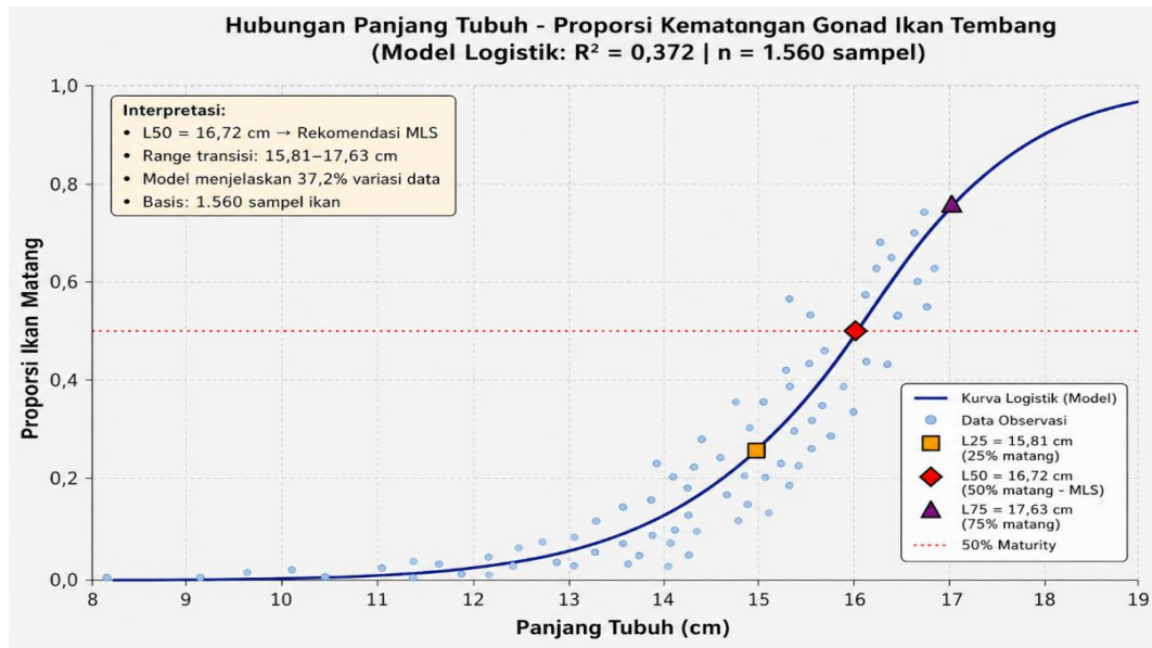
Gambar1. Relationship Curve between Total Length and Gonad Maturity Probability of