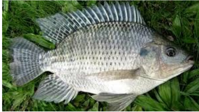
Gambar 1. Ikan nila ( Oreochromis niloticus ).