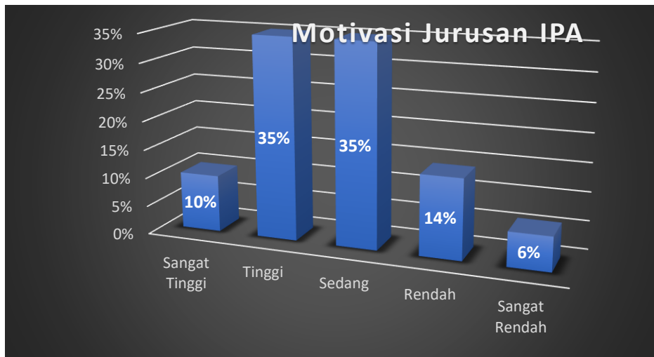
Gambar 1 Grafik Tingkat Motivasi Jurusan IPA

Sedangkan untuk motivasi jurusan IPS di SMA Negeri 1 Subang terhadap pembelajaran penjas adalah 8 siswa atau 40% siswa yang mempunyai motivasi sangat tinggi, 6 siswa atau 30% siswa memiliki motivasi tinggi, 5 siswa atau 25% siswa memiliki motivasi sedang, 1 siswa atau 5% siswa memiliki motivasi rendah, dan tidak ada siswa yang memiliki motivasi sangat rendah. Berikut adalah grafik tingkat motivasi siswa jurusan IPS: